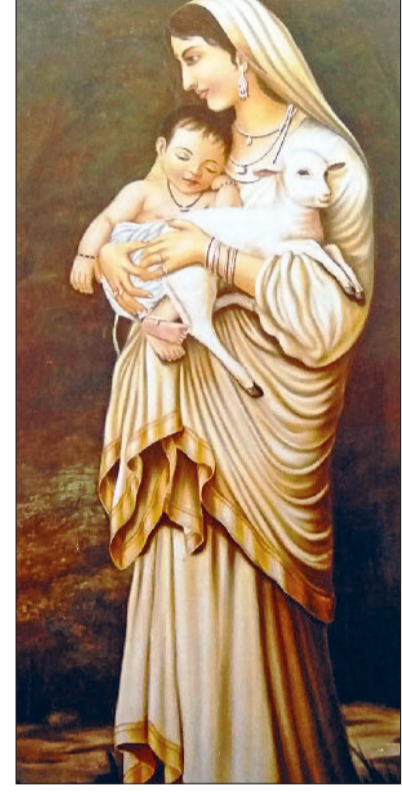
नारनौल। धर्मेन्द्र शर्मा की ओर से करीब 20 साल पहले तैयार की गई अंथिल पेंटिंग।