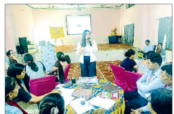
महेन्द्रगढ़। कार्यशाला में भाग लेते शिक्षक।