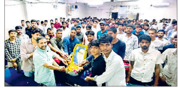
महेन्द्रगढ़। आंबेडकर के चित्र पर पुष्पांजलि करते हुए।