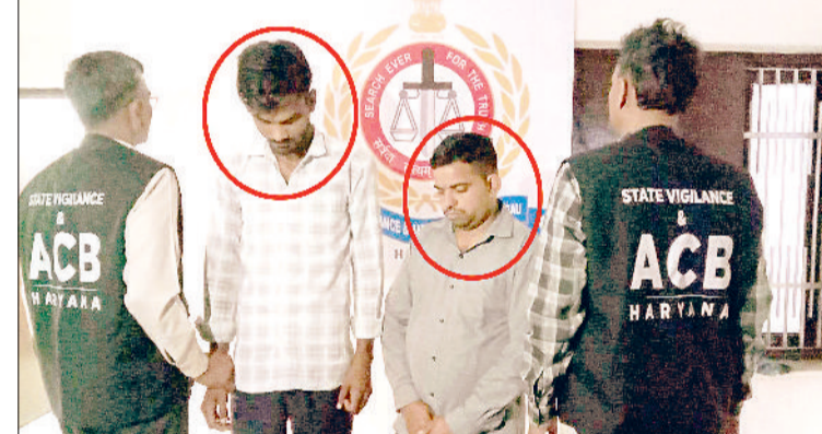
नारनौल। एसीबी की टीम द्वारा गिरफ्तार किए गए आरोपित।